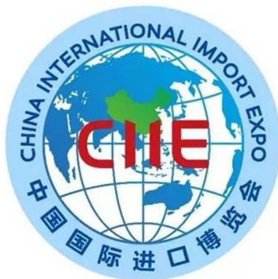
中国国际进口博览会标识。