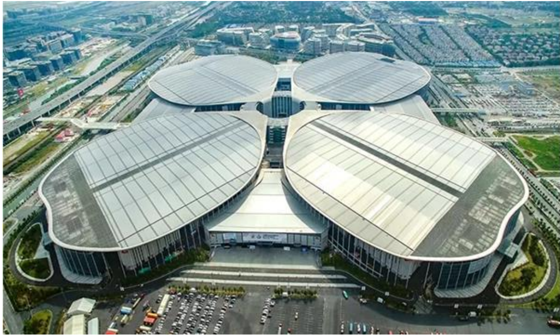
主展馆：国家会展中心(上海)。